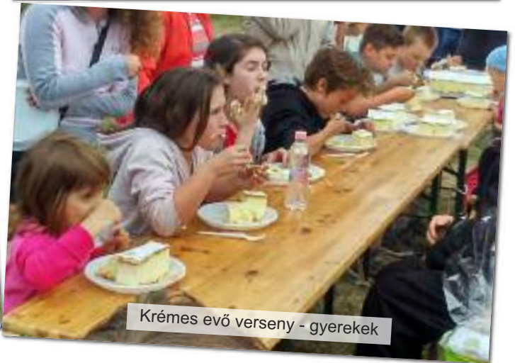
Krémes evő verseny - gyerekek