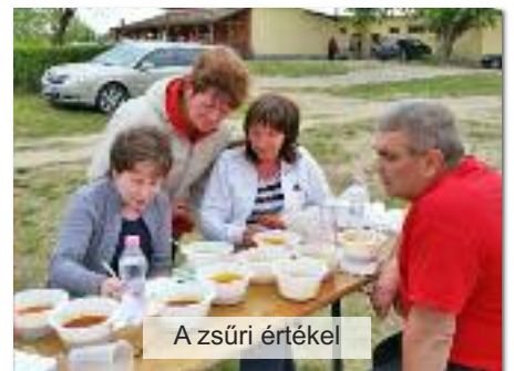
A zsűri értékel