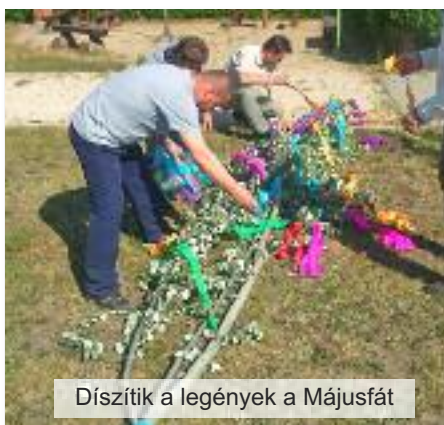
Díszítik a legények a Májusfát