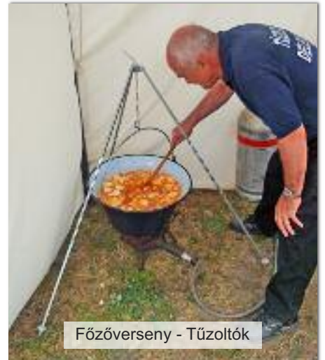
Főzőverseny - Tűzoltók