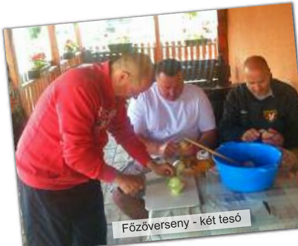
Főzőverseny - két tesó