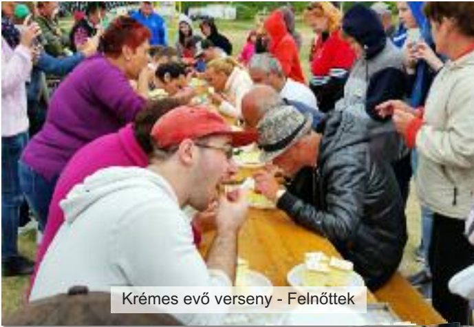
Krémes evő verseny - Felnöttek