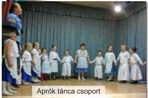
Aprók tánca csoport