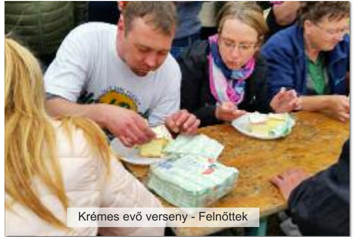
Krémes evő verseny - Felnöttek