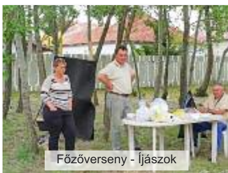
Főzőverseny - Íjászok