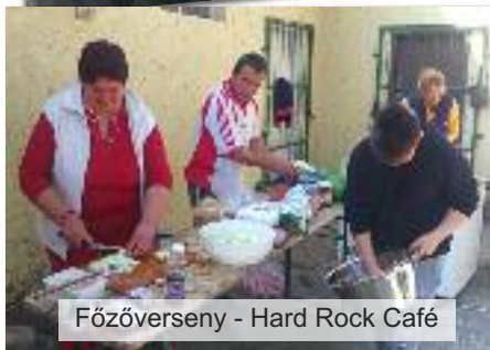
Főzőverseny - Hard Rock Café