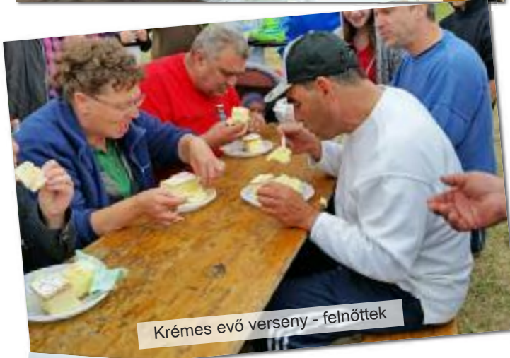
Krémes evő verseny - felnöttek