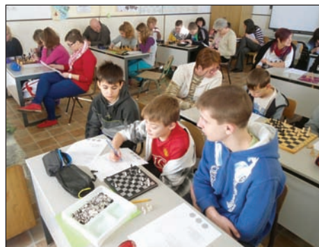
Sakk-matek bemutató óra a 6. osztályban