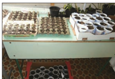
Kelnek a konyhakerti magvak