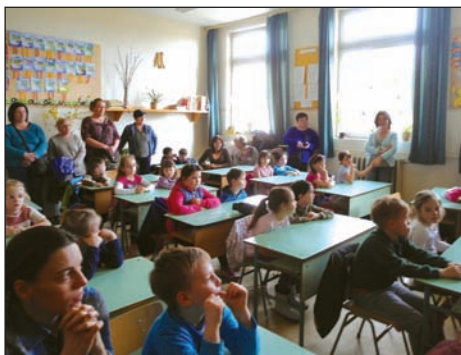
Ovisok és szülei az iskolában