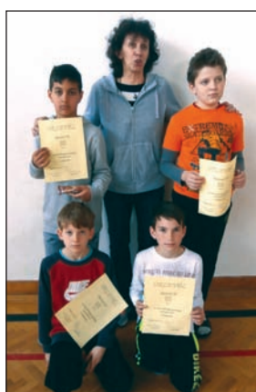
Kancsal SC – az alsós focibajnokság győztes csapata