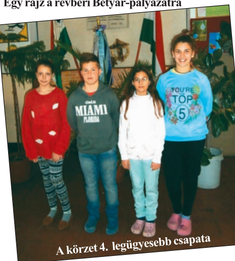
A körzet 4. legügyesebb csapata