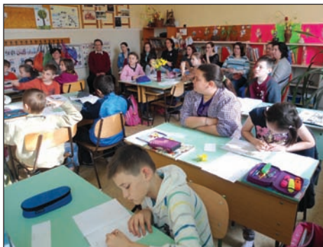
Leendő elsősök szülei a 4. b-ben