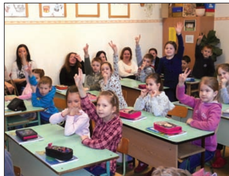
Nyílt nap az 1. o.-ban