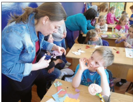
Ovisok az elsősben