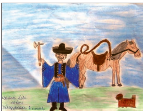
Egy rajz a révbéri Betyár-pályázatra