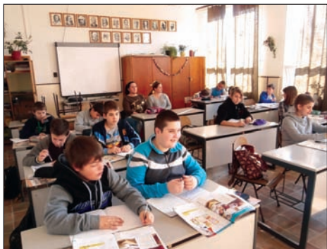
Angolóra a 6.-ban