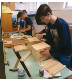
Készülnek a madáretetők az iskolakertbe