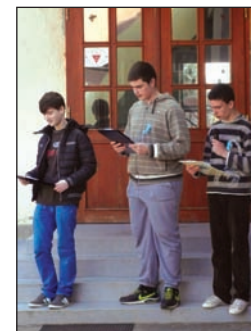
A kék szalag az autisták világnapját jelzi